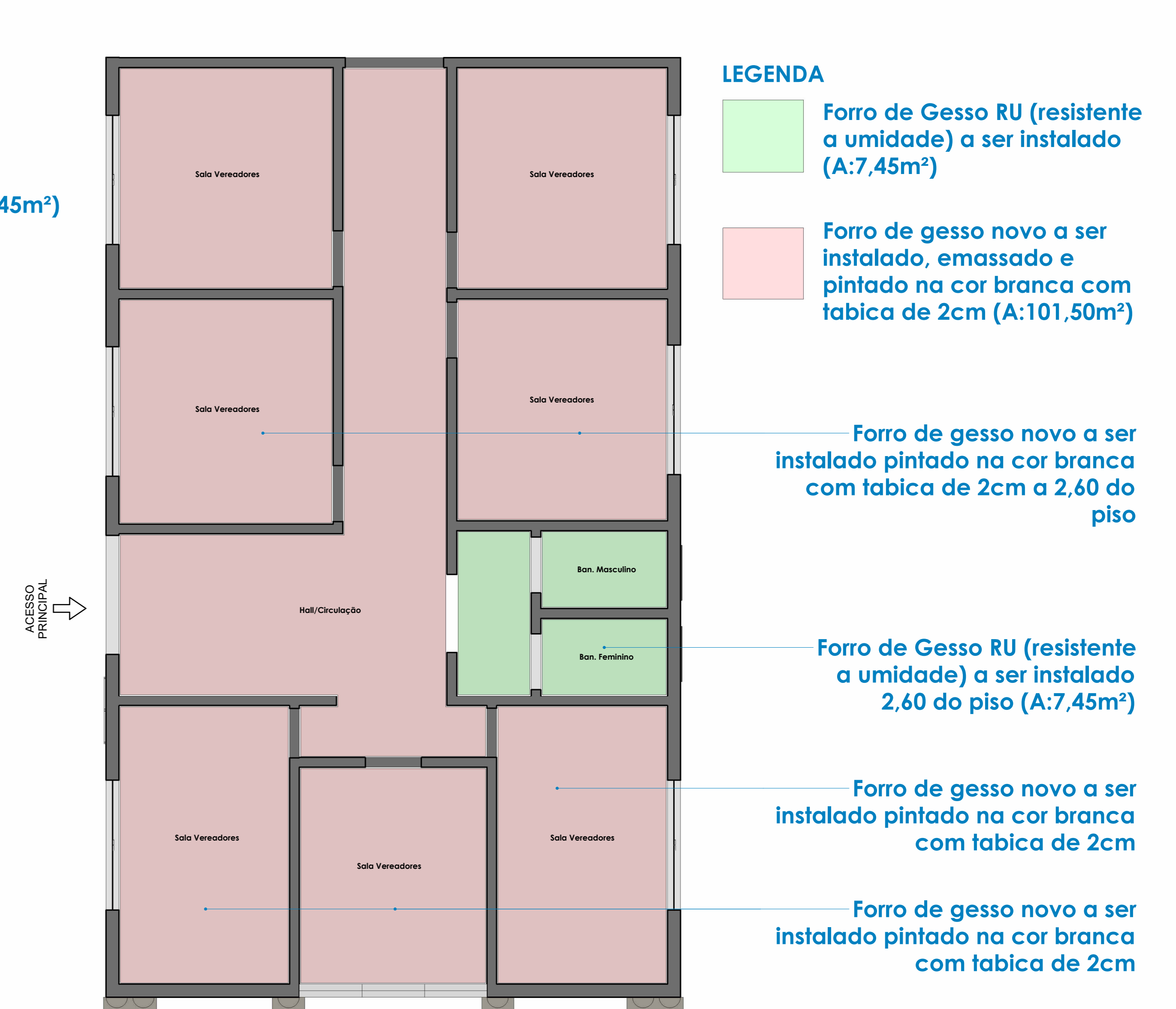
Tabela de Quantitativos ESC: 1 : 50